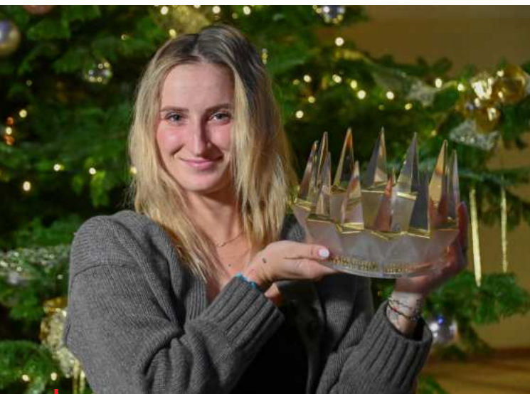
Loňská wimbledonská vítězka Markéta Vondroušová začínala se svým sportem v Tenisovém klubu Sokolov