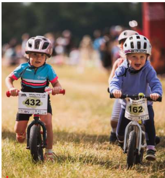
Tam, kde není registrováno dvacet mladých sportovců, kluby už na dotaci od NSA nedosáhnou

Členové Výkonného výboru ČUS reagovali na důsledek novely zákoníku práce a přijetí tzv. vládního konsolidačního balíčku. V něm obsažená nová právní úprava uzavírání dohod o pracích konaných mimo pracovní poměr - především dohod o provedení práce (DPP) - se velice negativně dotkla celého sportovního prostředí a nesmírně komplikuje, často dokonce znemožňuje použití tohoto smluvního nástroje.