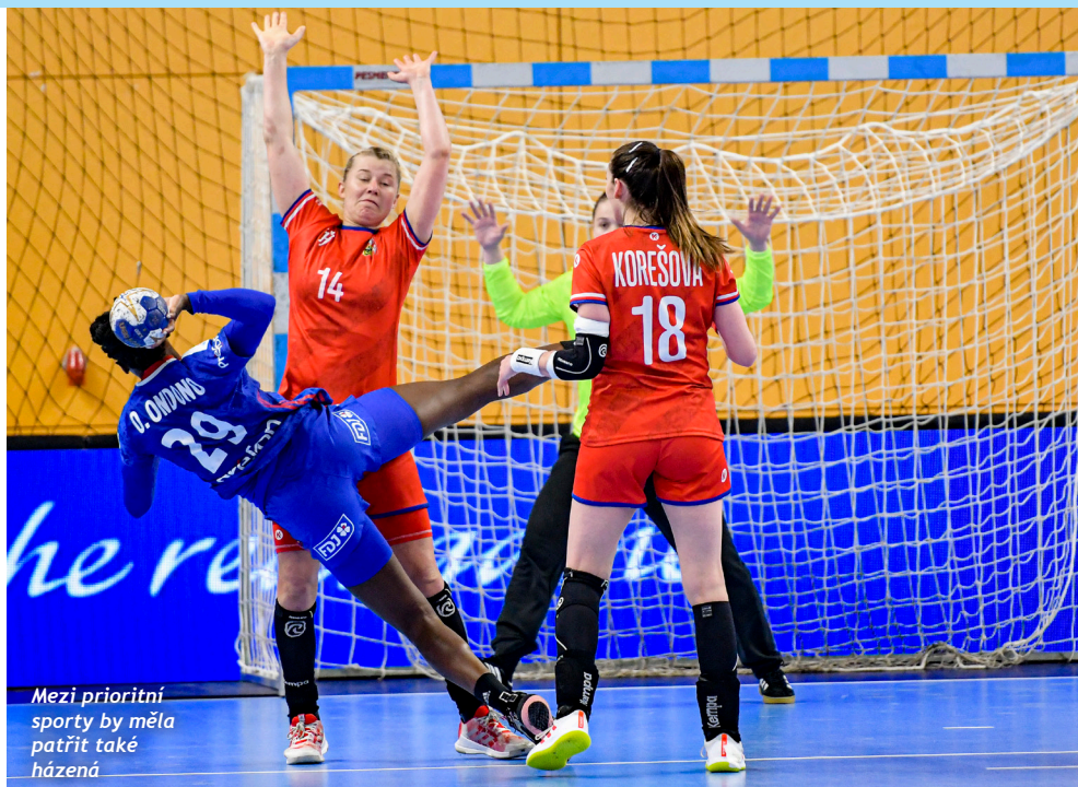
Mezi prioritní sporty by měla patřit také házená

Národní sportovní agentury „Zastřešující sportovní organizace“ na rok 2024. Ta zahrnuje z převážné části dotace na činnost územních pracovišť ČUS (Servisních center sportu) podporujících práci sportovních klubů ve 14 krajích a 75 okresech. Částečně pak také na provoz sportovních středisek ve vlastnictví ČUS (SC Nymburk, PS Podolí), na celorepublikový projekt pro sportování veřejnosti (Sportuj s námi) a na činnost centra ČUS.